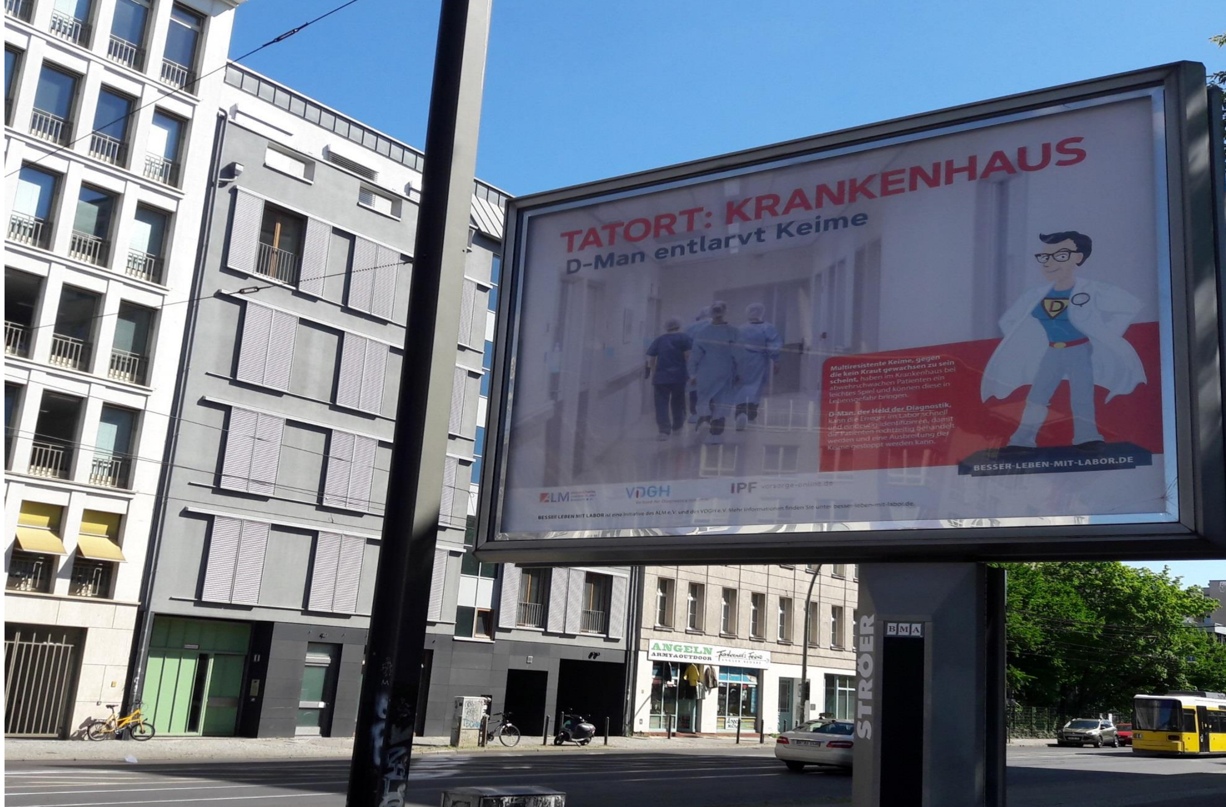
Berlin Invalidenstr. 134