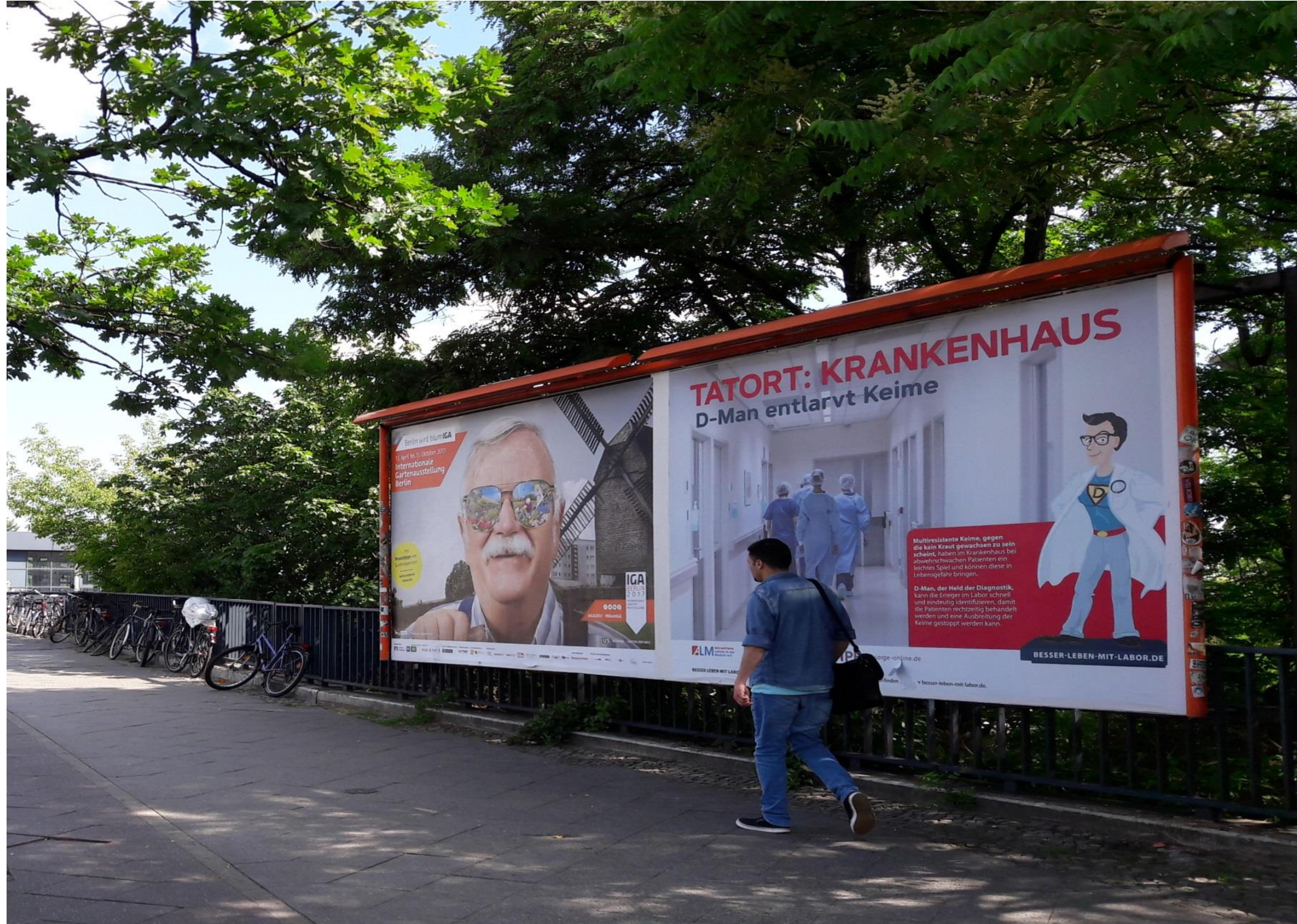
Berlin Beusselstr. 44