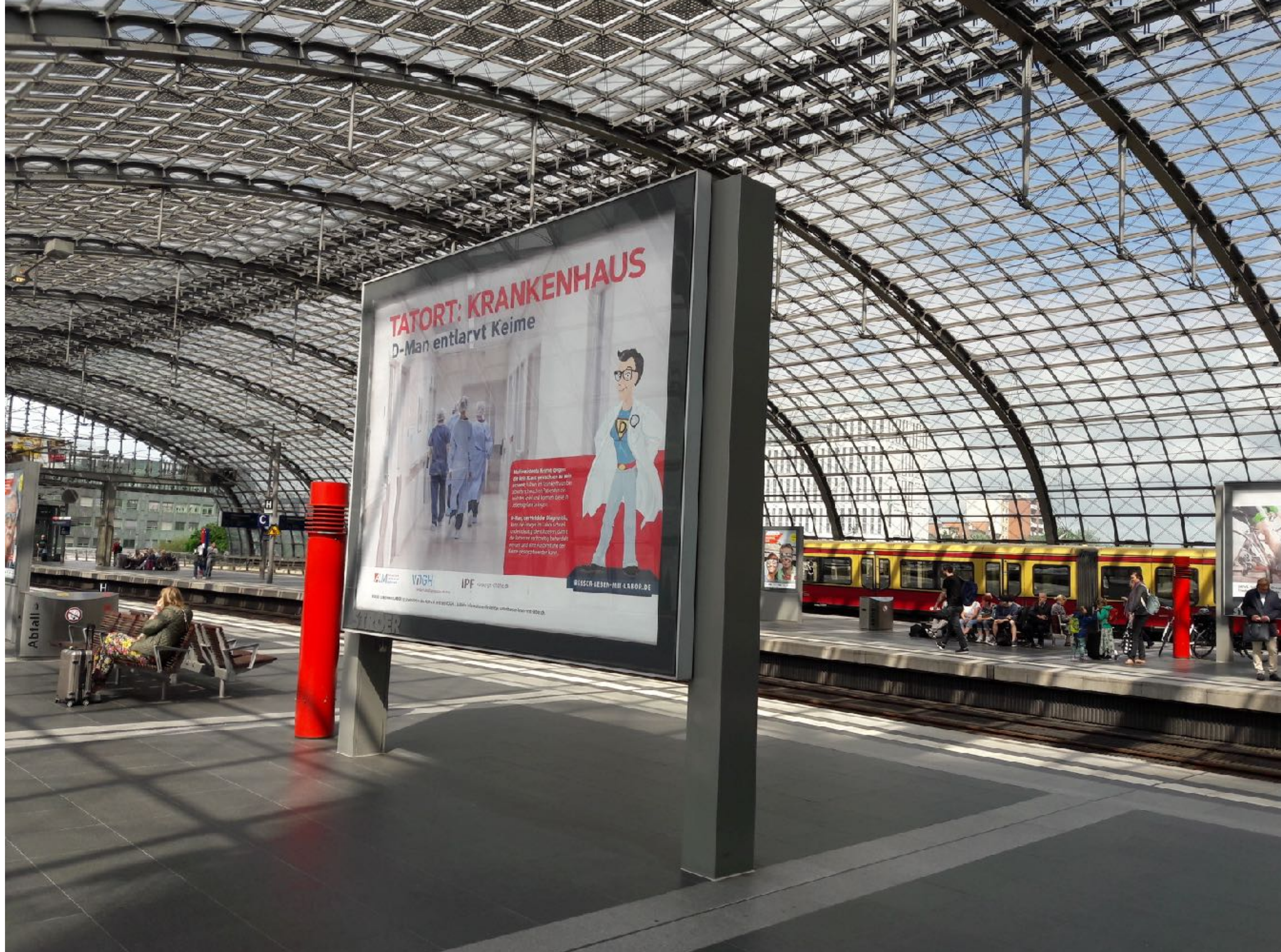
Berlin Hbf Fernbahnsteig Gleis 11