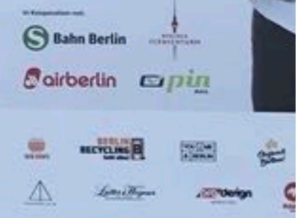
Berlin Saatwinkler Damm 9