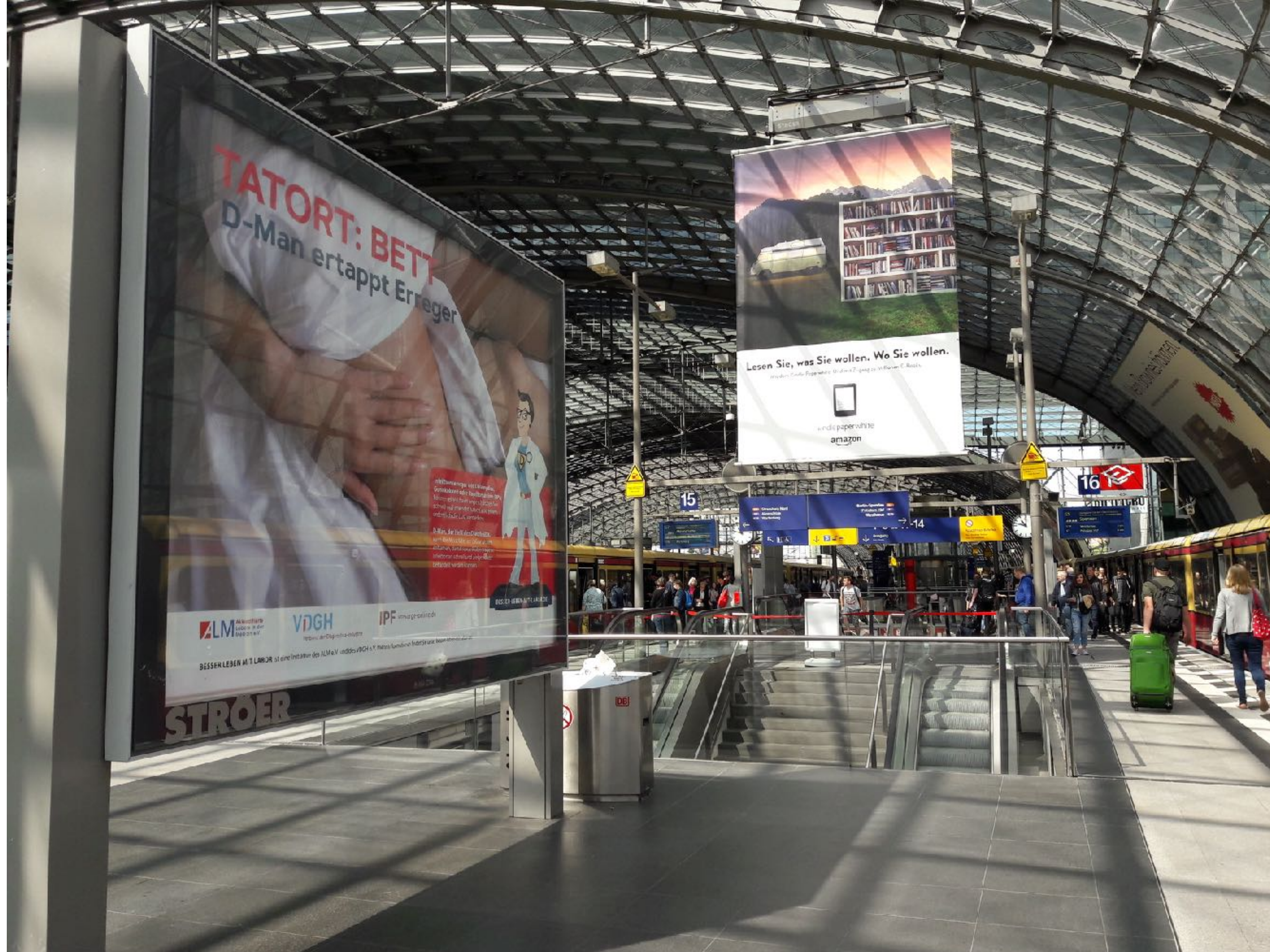
Berlin Hbf S-Bahnsteig Gleis 16